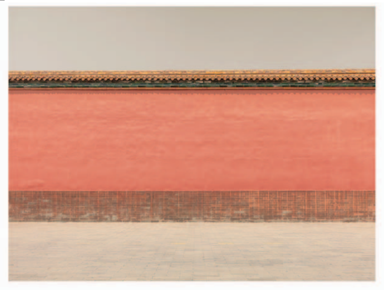
Ljubodrag ANDRIC - China 2, 2013